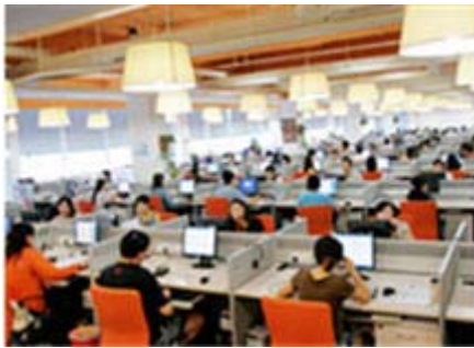
Alibaba ne vérifie pas la qualité des fournisseurs

Pour vérifier la qualité des fournisseurs chinois présents sur Alibaba, l'idéal reste de se rendre sur place. A défaut, le site fournit des moyens de communication utiles . L'application "Trade manager", la messagerie instantanée d'Alibaba, permet ainsi aux partenaires potentiels de communiquer facilement. D'autant plus qu'elle contient une fonction de traduction automatique à partir du chinois.