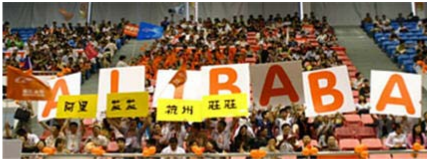
L'un des géants de l'Internet chinois

Toute entreprise qui s'est intéressée aux faibles coûts de production chinois le connaît probablement. Avec environ 1,7 million d'usines inscrites, Alibaba.com fait figure de porte d'entrée évidente vers la Chine . Car si la société chinoise veut désormais développer sa dimension mondiale, on retrouve encore sur son site une majorité de fournisseurs chinois.